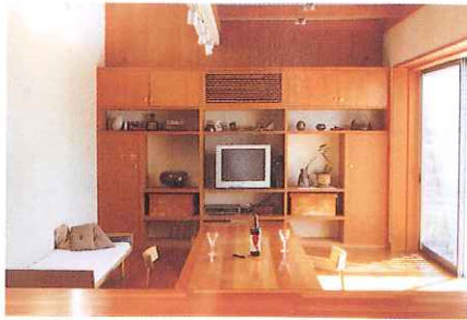
2. living room