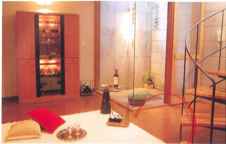
1. wine room