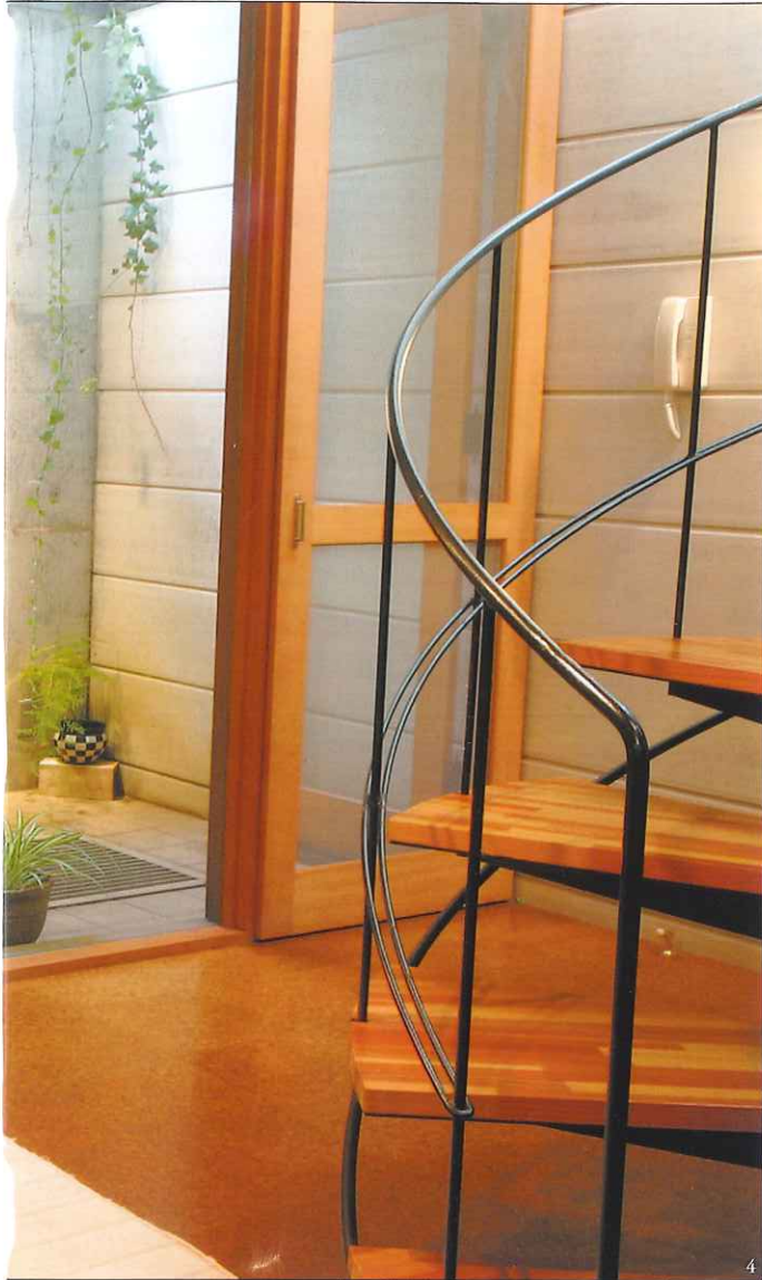
4 ドライエリアからの光と風、そして目にも優しいグリーンが大人の時間をより豊かなものにしてくれる